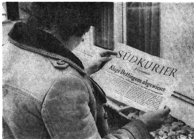
EIN SÜDKURIER-EXTRABLATT meldete schon gestern mittag die Urteilsbegründung des Staatsgerichtshofs zur Abweisung der Klage von Dettingen-Wallhausen gegen die Eingliederung in die Stadt. (Bericht siehe Seite „Südwestdeutsche Umschau“.)